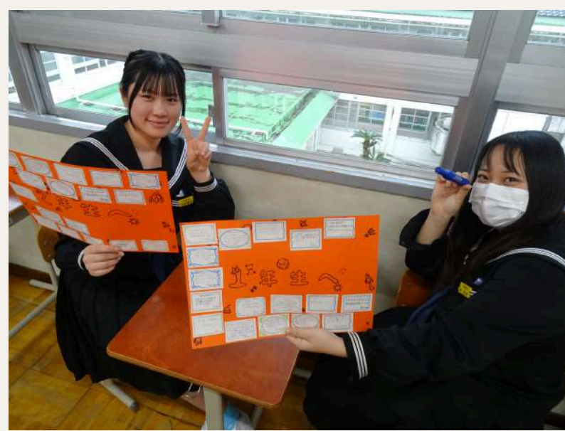
3年旅立ちプロジェクト