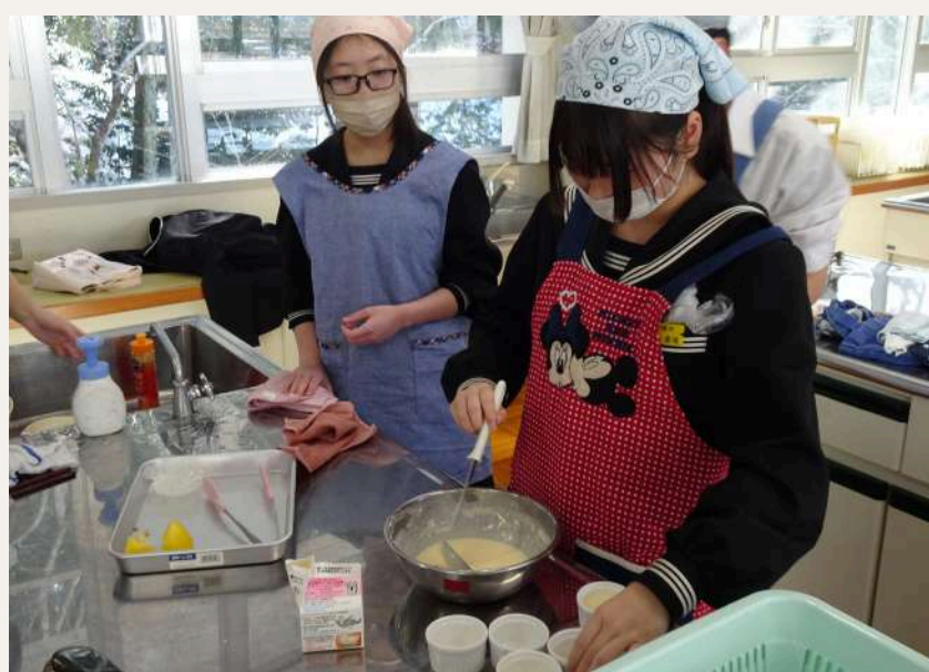
3年家庭科チーズケーキ作り