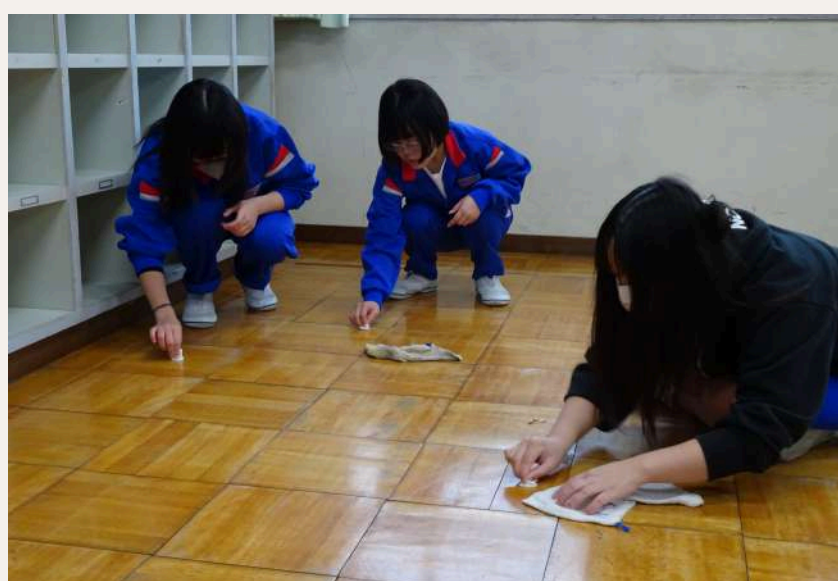
3年旅立ちプロジェクト